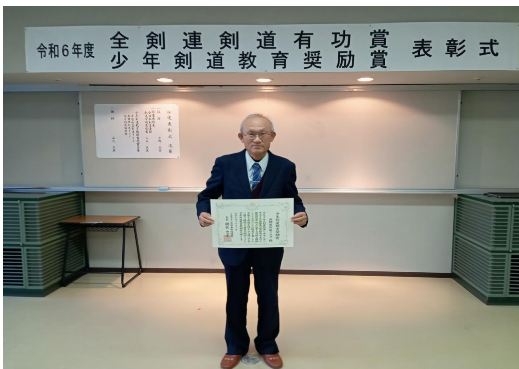
南郷里剣道クラブ